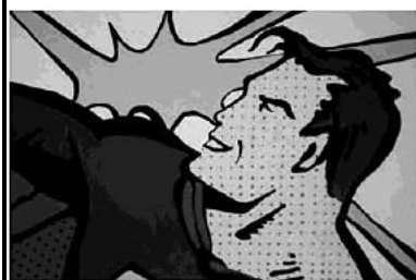
Roy Liechtenstein. Super-Homem, 1964. Serigrafia. (Disponível em: < http://micolebexart.webs.com/ >. Acesso em: 29 jul. 2011.)

O Super-Homem ganha poderes pelos efeitos dos raios solares, mas tem uma fraqueza: o minério criptonita. O Homem-Aranha adquire habilidades depois da picada de um aracnídeo. O Quarteto-Fantástico nasce dos efeitos de uma tempestade cósmica. Um a um, os elementos da natureza tornam-se importantes para o nascimento de vários super-heróis