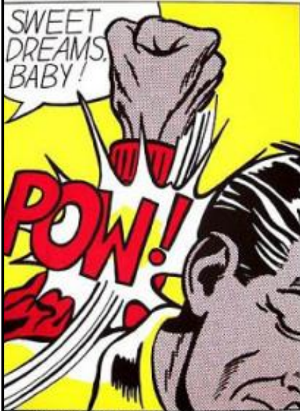
Serigrafia de Roy Lichtenstein, exposta na mostra "Originals - A Gravura desde o Século XV", no CCBB, São Paulo, 2008.